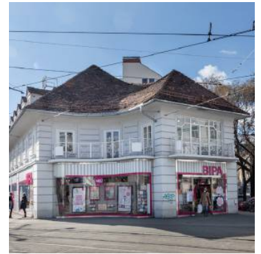
Heute begrüßt Bipa im mehrfach umgebauten Haus Kunden. Konstantinov